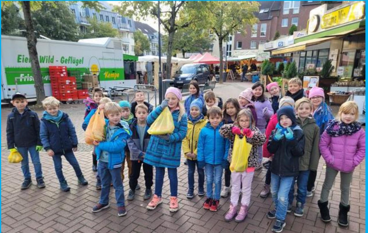
"Nachschlag" zum Zirkusprojekt - Fotos vom Förderverein (26.09.2023)