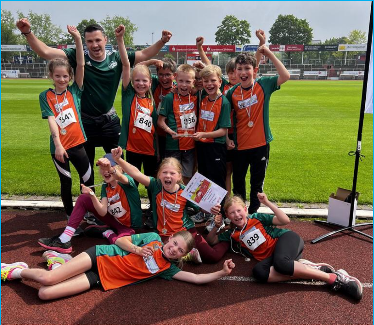
Rheinische Post (02.05.2024)