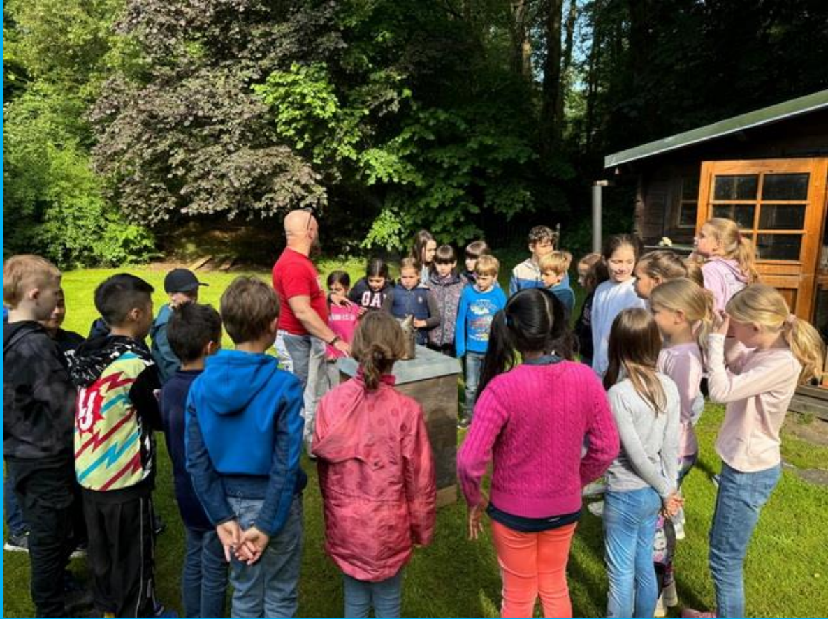
Besuch der BayArena - 2b (05.06.2024)