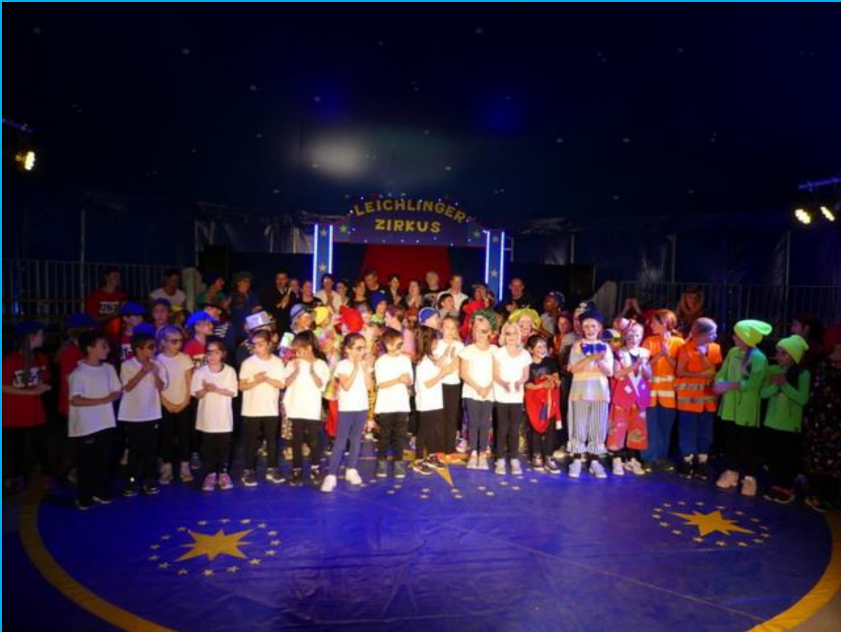
Aufführung 3 - 15Uhr