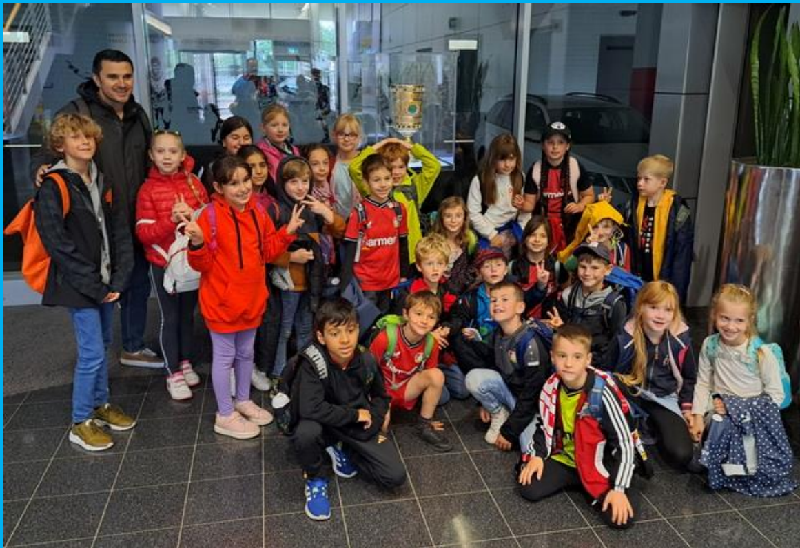
Leichlinger Schulschwimmfest (25.05.2024)