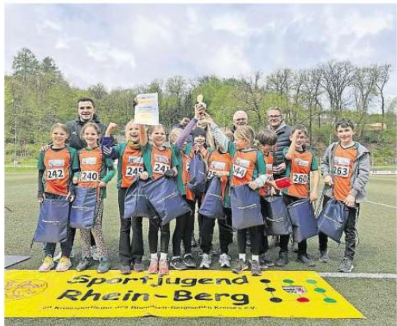
Schülerinnen und Schüler der katholischen Grundschule Leichlingen waren beim Leichtathletikwettbewerb NRW Youngstars erfolgreich.